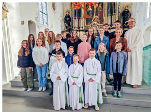
Foto: Mini-Aufnahme 2023

Mit grosser Freude dürfen wir sieben neue Ministrantinnen und Ministranten in unseren Dienst aufnehmen und sieben langjährige Ministrantinnen und Ministranten verabschieden.