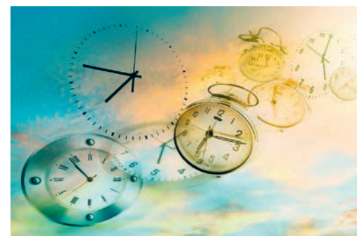
«Zeit ist jetzt»

Mittwoch, 24. April, Pfarrzentrum Waldkirch 19.00 Uhr Türöffnung 19.30 Uhr Nachtessen anschliessend geschäftlicher Teil