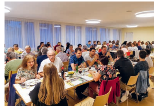
Dankeschön-Abend der Pfarrei