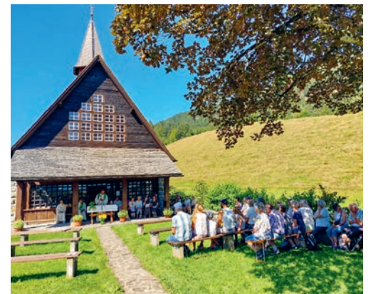
Eucharistiefeier bei der Ahorn-Kapelle