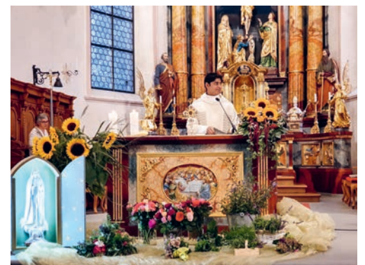
Kräutersegnung der Frauengemeinschaft