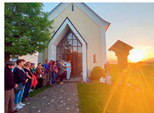
Maiandacht mit der Frauengemeinschaft

des Sekretariats während der Sommerferien (Montag 11. Juli bis Freitag, 12. August) Jeweils Dienstag und Freitag von 9.00 Uhr bis 11.00 Uhr. Für weitere Termine oder in dringenden Fällen wählen Sie bitte die Pfarramtsnummer T 071 433 11 21.